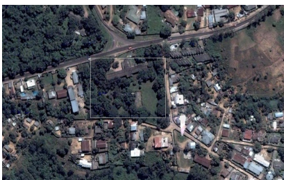
Kinshasa (Presbytère méthodiste)

Merci de nous soutenir dans la prière pendant ce voyage et que la puissance de Dieu se manifeste au travers de ce peuple.